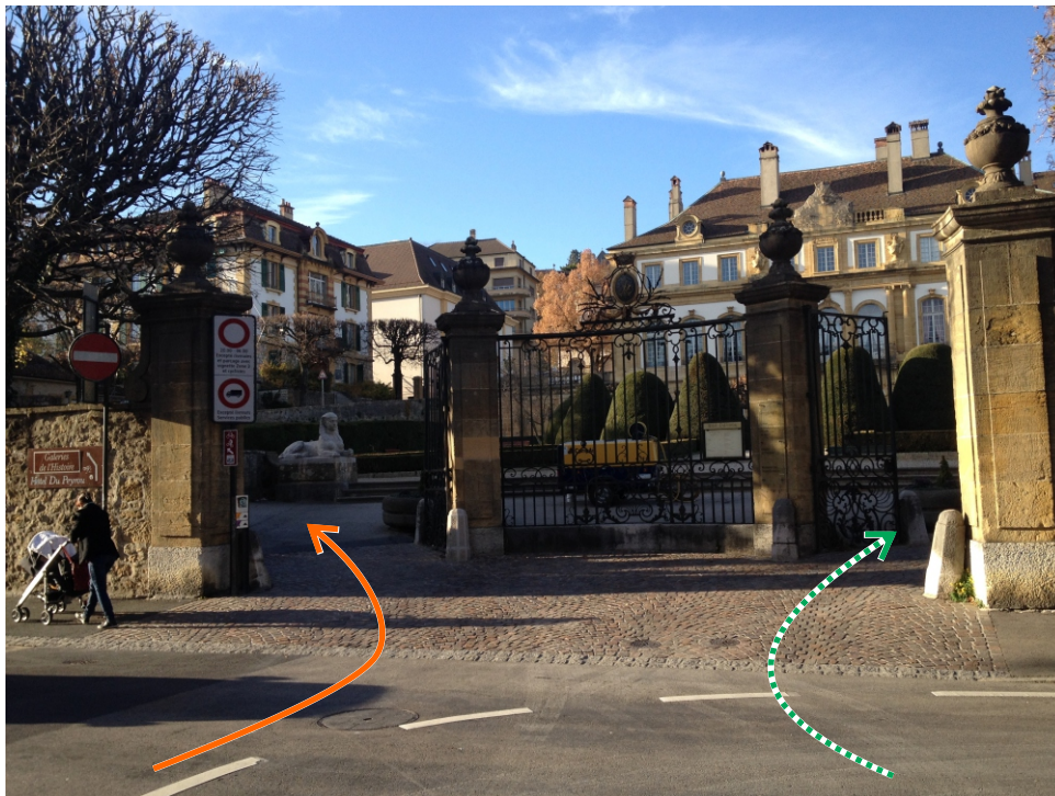
Portail sud de l'hôtel du Peyrou, sur le Faubourg de l'Hôpital. Monter à gauche, (seul accès en voiture possible pour P&TS).