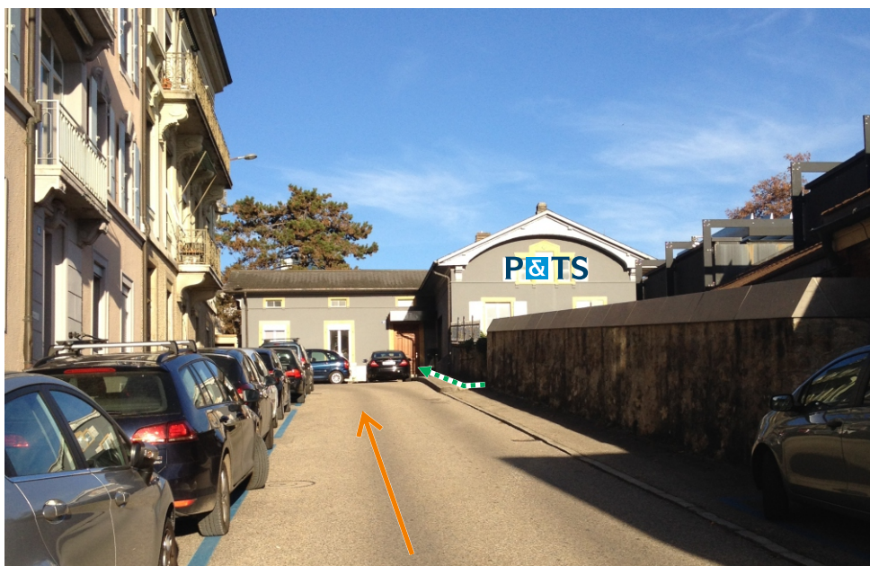
Contourner l'Hôtel du Peyrou, l'immeuble P&TS se trouve juste en-dessus.